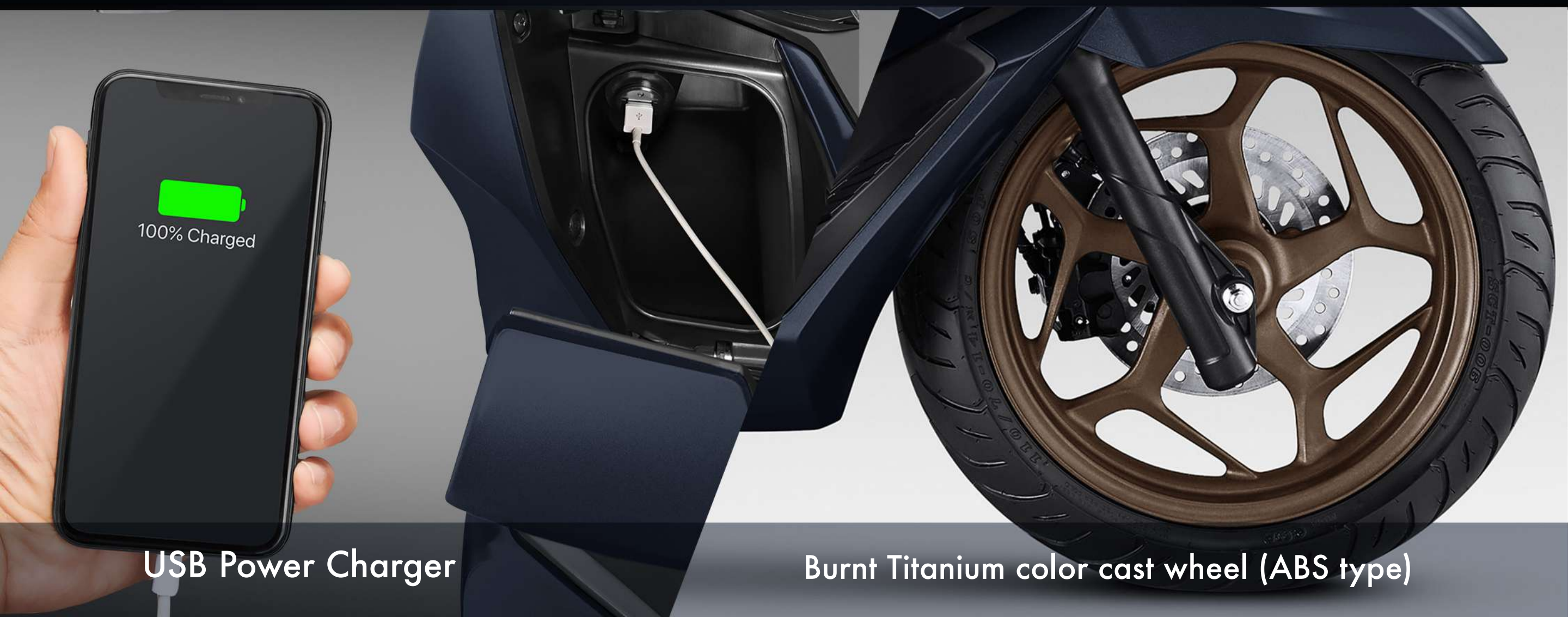
USB Power Charger