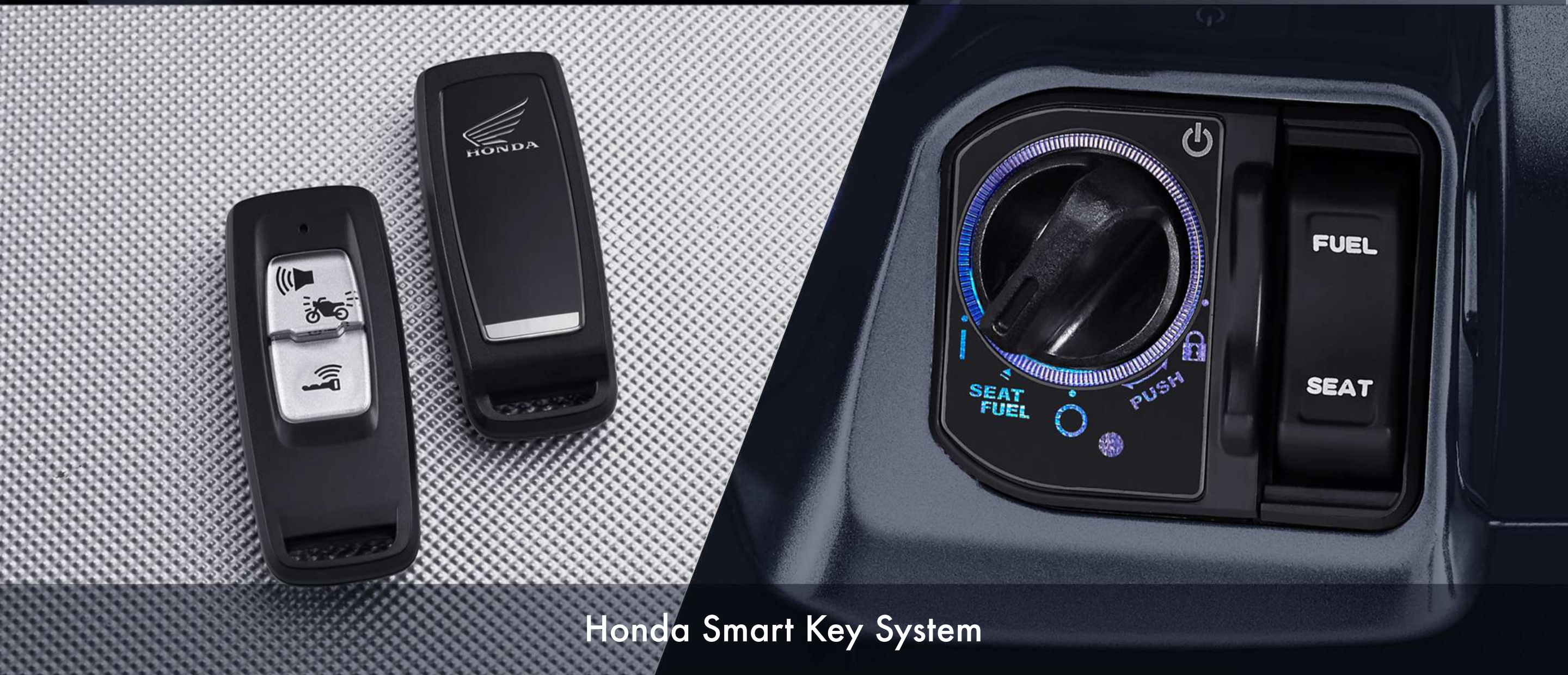
Honda Smart Key System