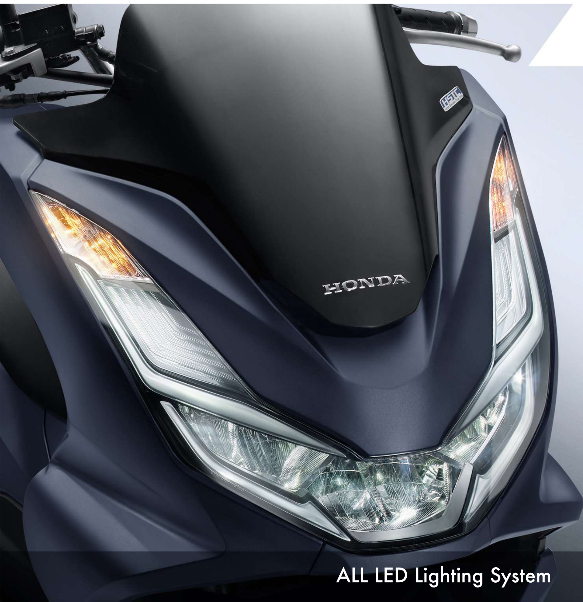
ALL LED Lighting System