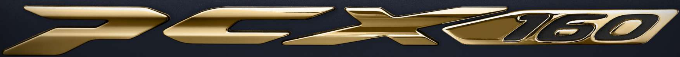
Gold Emblem (ABS type)