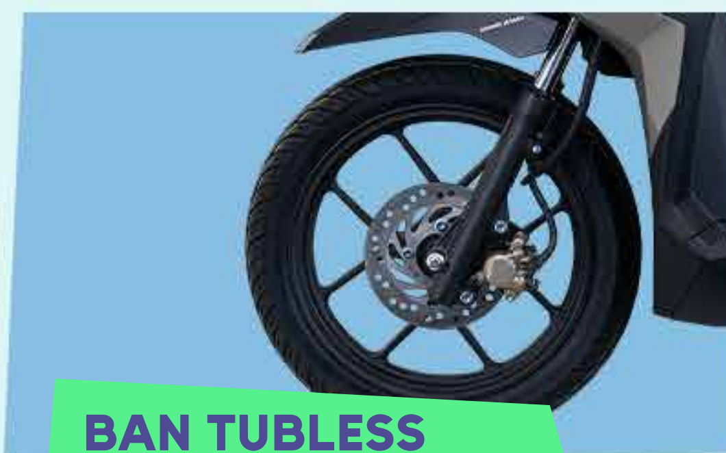
BAN TUBLESS DENGAN VELG SPORTY