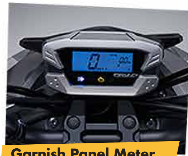
Garnish Panel Meter (khusus Honda BeAT Street)