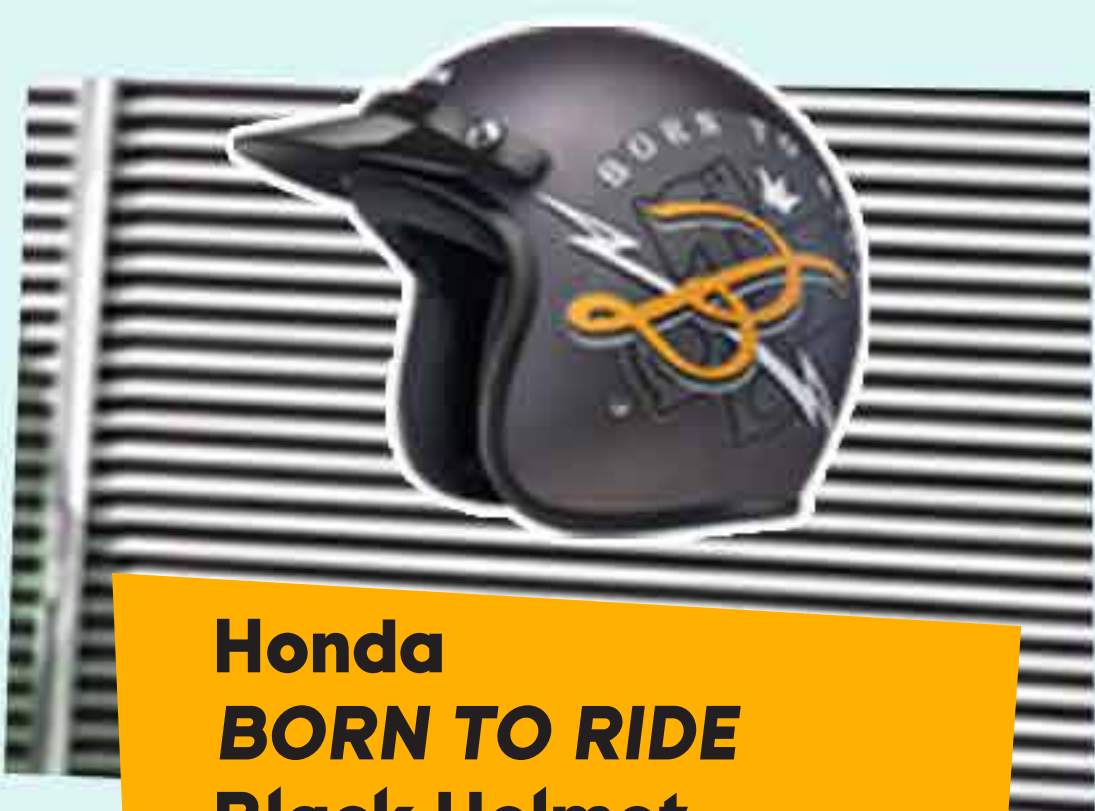
Honda BORN TO RIDE Black Helmet

Honeycomb Helmet, Honda Long Sleeve T-Shirt, Black Waist Bag