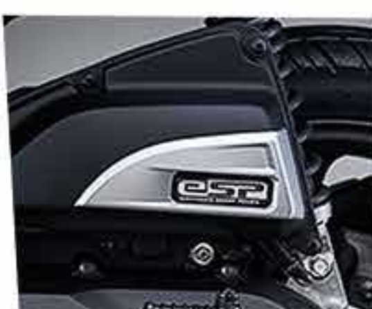
Garnish Air Cleaner*