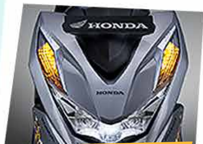
Garnish Front Winker*