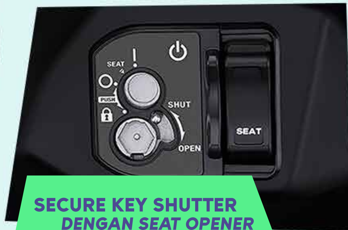
SECURE KEY SHUTTER DENGAN SEAT OPENER