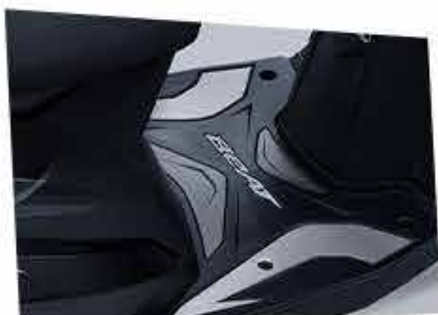
Rubber Step Floor*