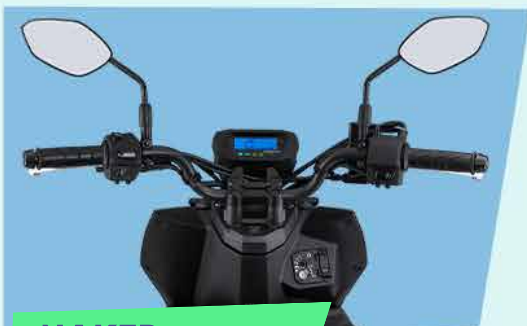
NAKED HANDLE BAR*