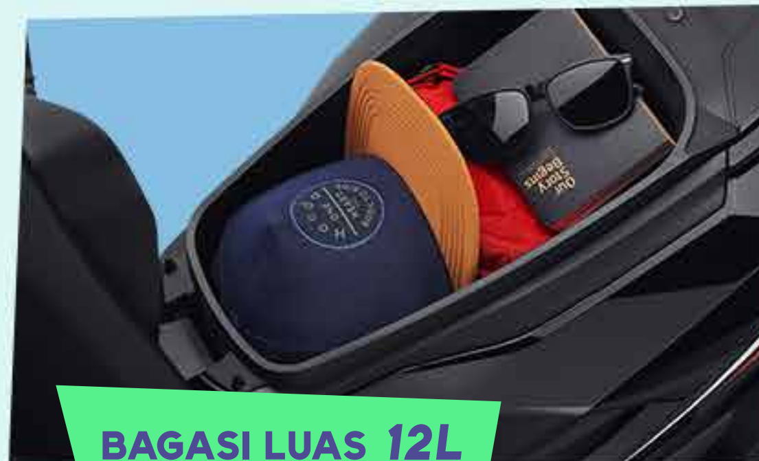
BAGASI LUAS 12L