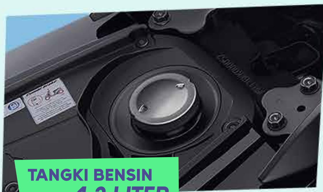
TANGKI BENSIN 4,2 LITER