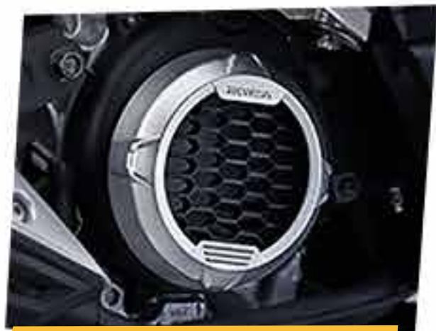
Garnish Fan Cover*