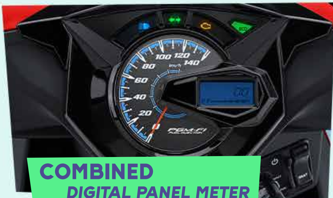
COMBINED DIGITAL PANEL METER