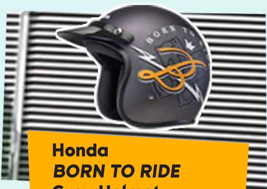
Honda BORN TO RIDE Grey Helmet

Born to Ride Black T-Shirt, Born to Ride Snapback, Born to Ride Rubber Band