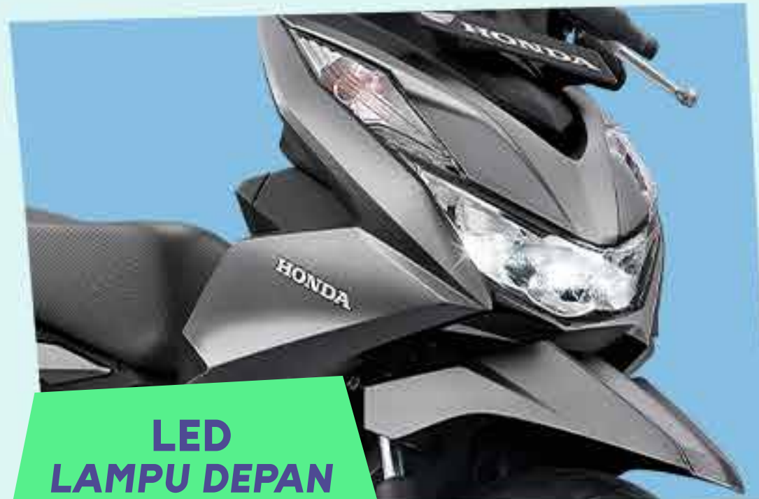
LED LAMPU DEPAN