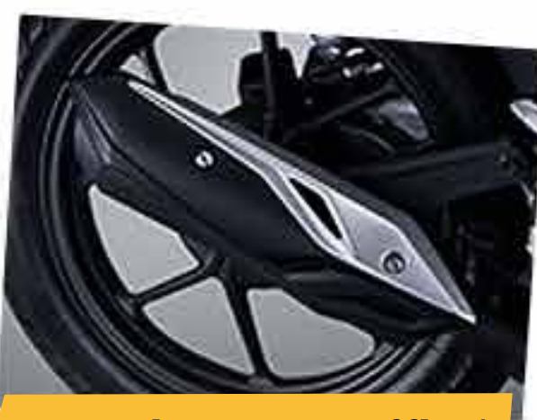
Garnish Cover Muffler*