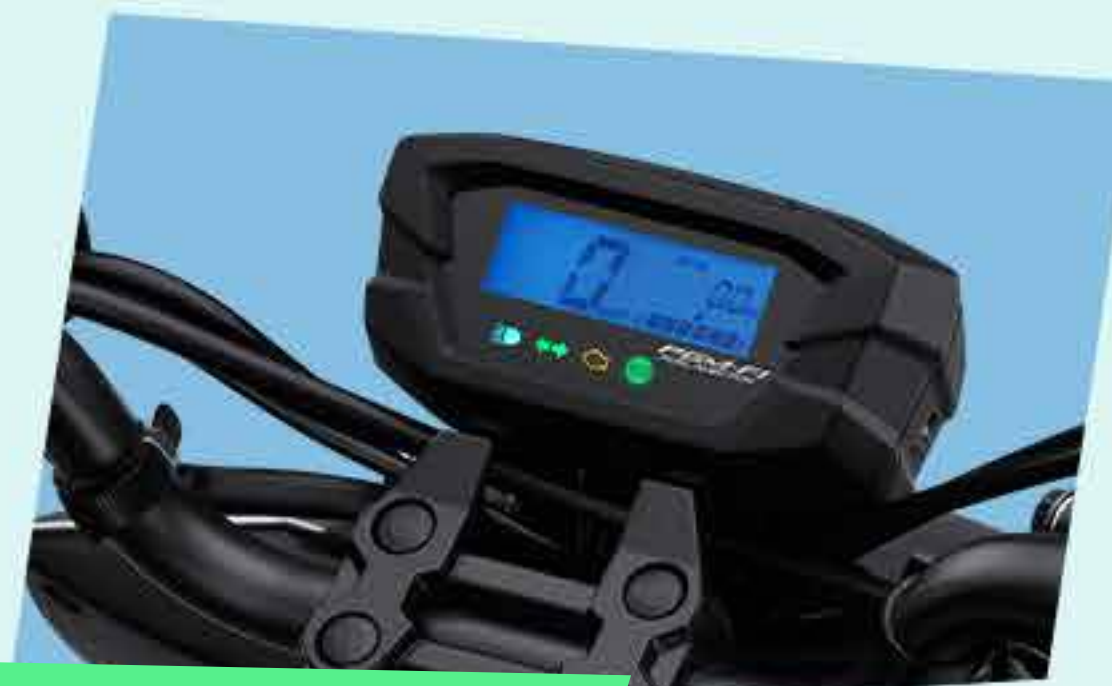
FULL DIGITAL PANEL METER*