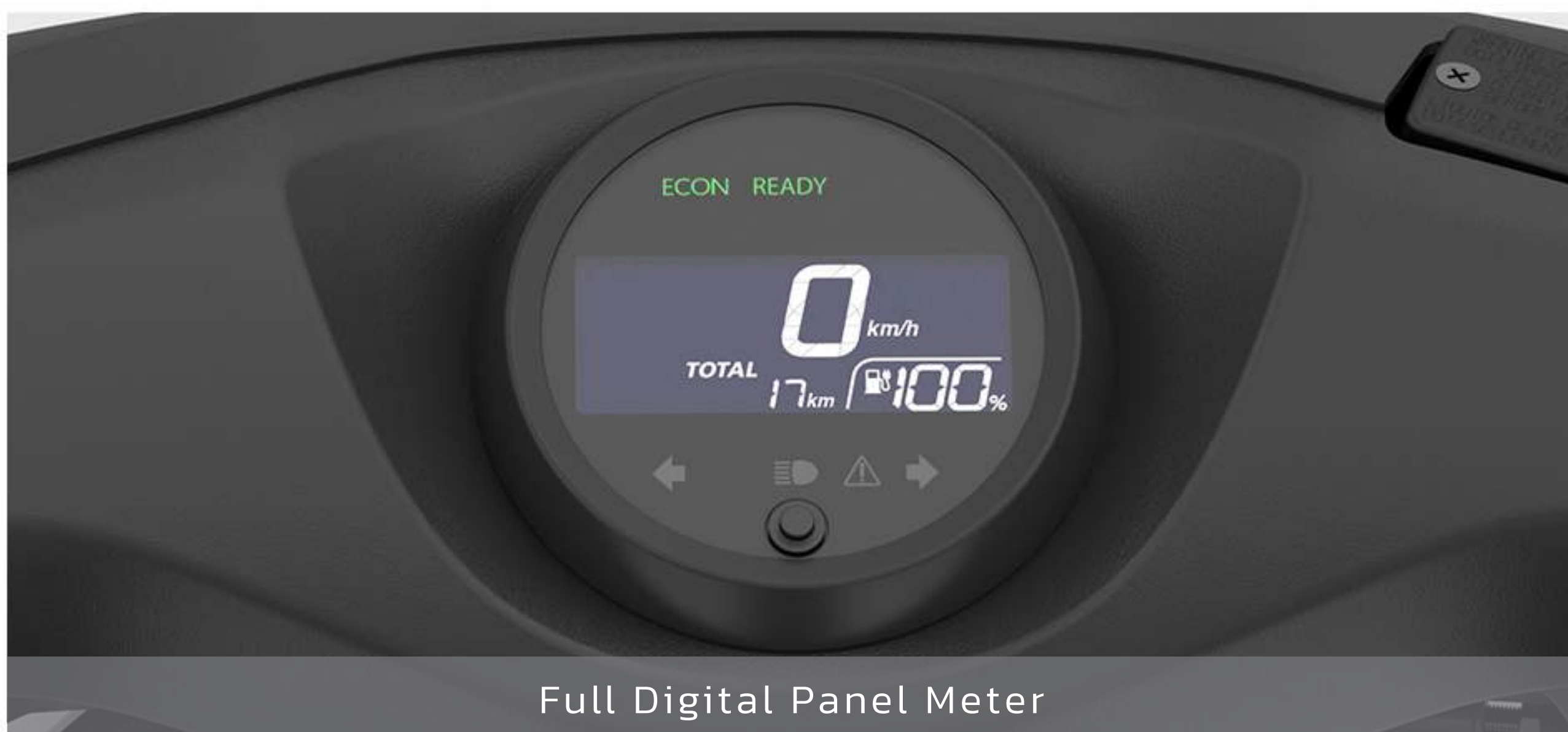
Full Digital Panel Meter

Perjalanan menjadi semakin mudah dengan fitur yang praktis untuk menunjang segala aktivitas berkendara.