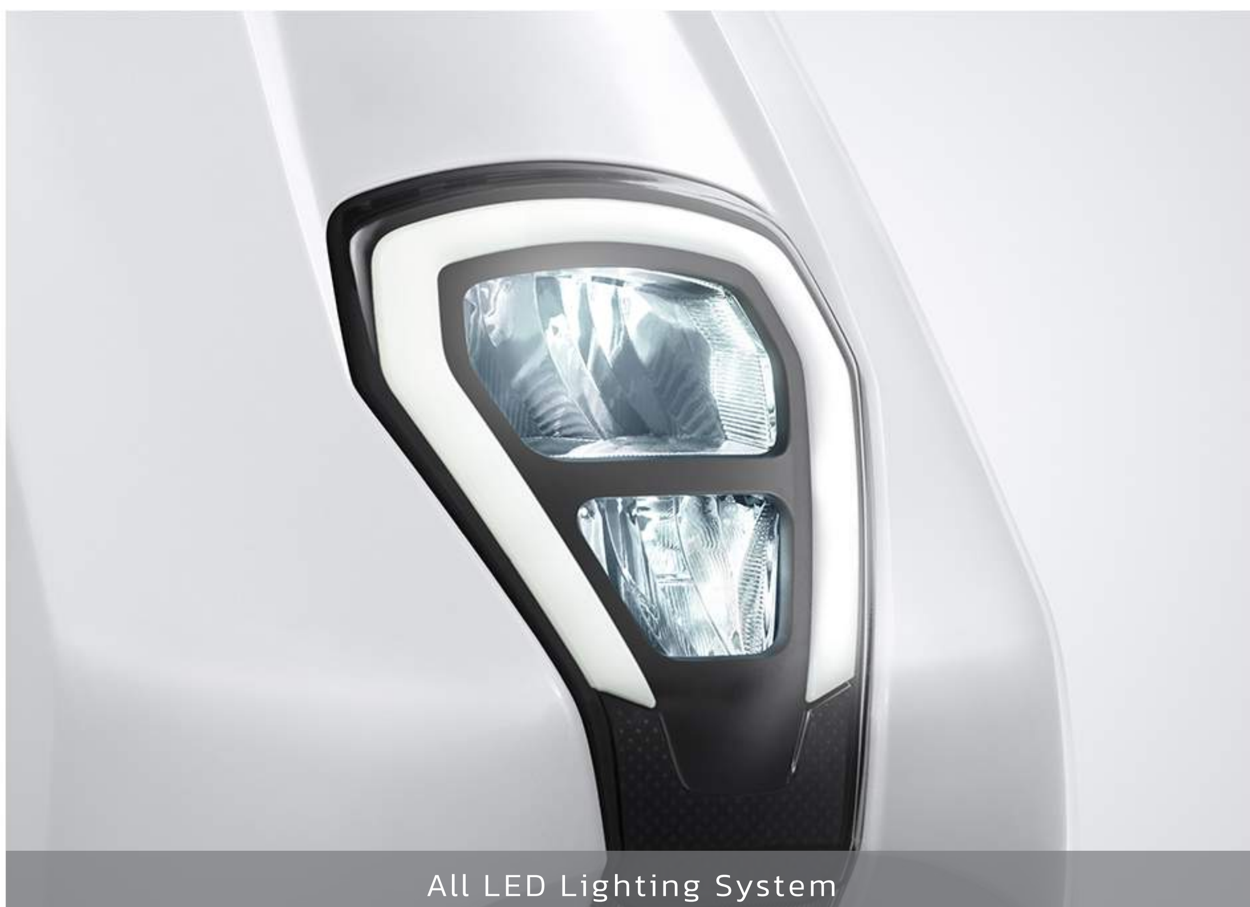
All LED Lighting System