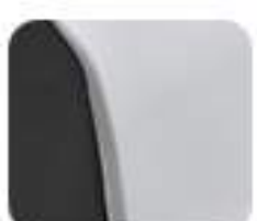
Innovative White (EM 1 e:)