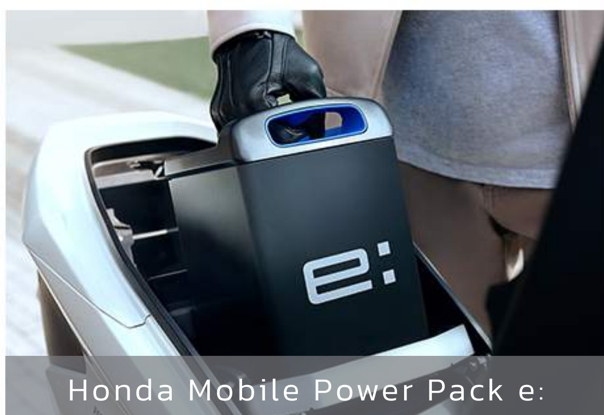
Honda Mobile Power Pack e: