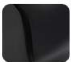
Intelligent Matte Black (EM 1 e:)