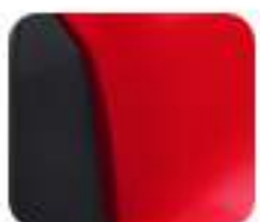
Smart Red (EM 1 e:)