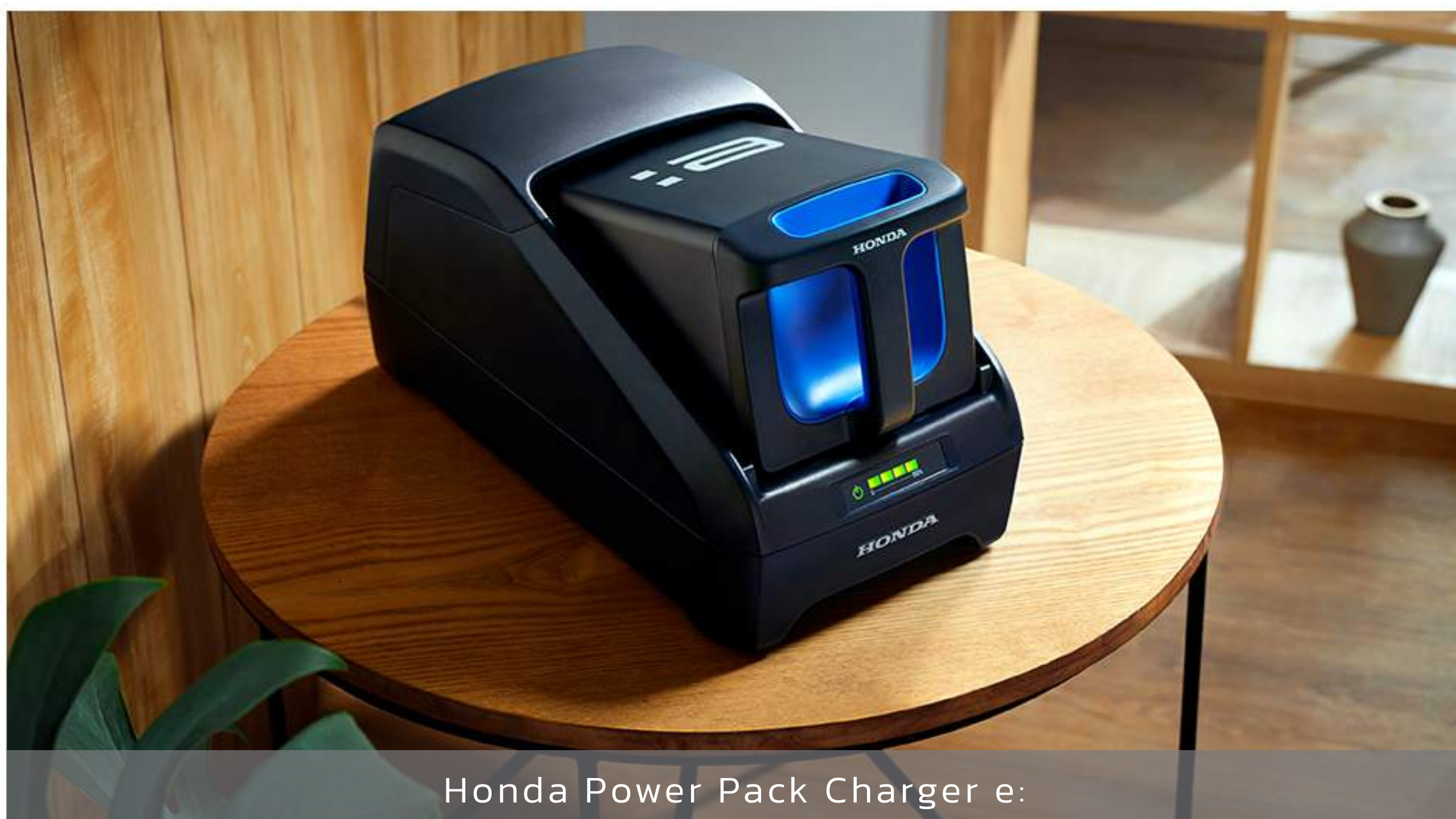
Honda Power Pack Charger e: